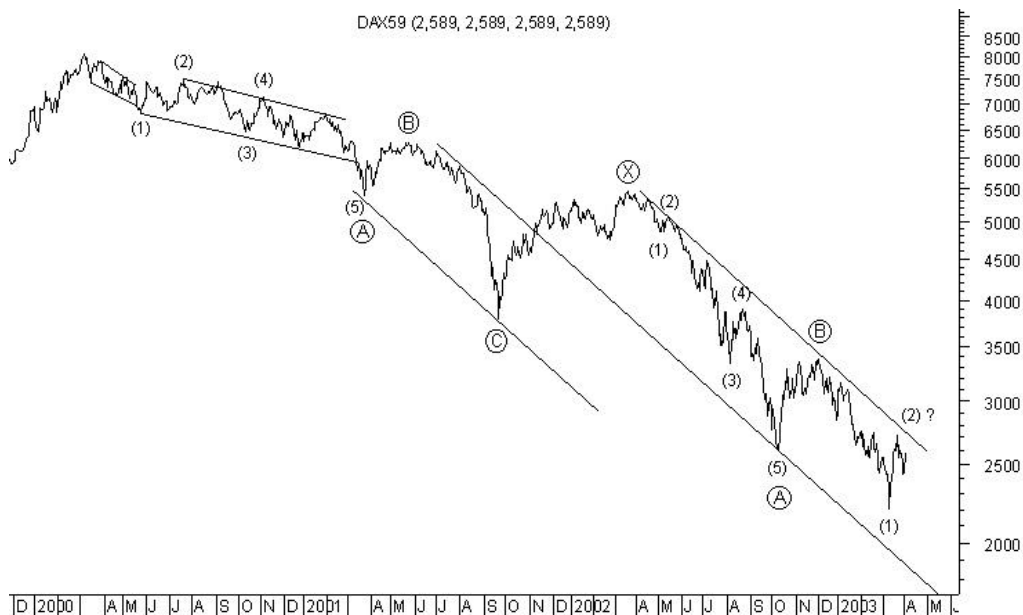
Chart 3: DAX (Alternativzählung)

Die beste Alternativzählung ist, wie im Chart 3 zu sehen ist, am Ende nicht ganz so pessimistisch. Wir gehen in unserer Alternative von einer W-X-Y-Korrektur oder 'Double Three' aus, wobei Welle W sich als Zigzag entwickelt hat. Nach einer erfolgten Zigzag-Korrektur X nach oben befinden wir uns mittlerweile in Welle Y abwärts, die den DAX bis auf den Ausgangspunkt der Welle IV aus dem Jahr 1982 führen kann. Auch das mutmaßliche Ende der anschließenden C-Welle wäre hierbei nicht ganz so niedrig anzusetzen wie bei unserer Primärzählung. Hier wären aber ebenso ca. 1500 Punkte als eine untere Zielmarke anzusehen.